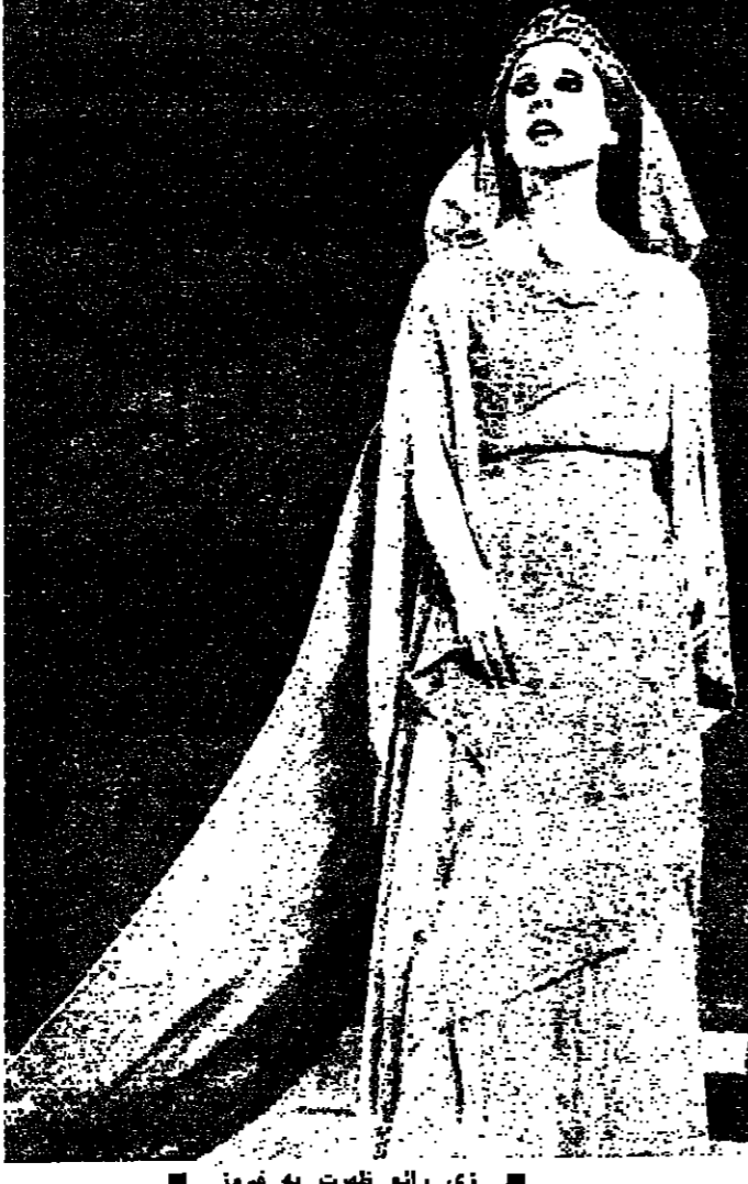
زي رائع ظهرت به فيروز